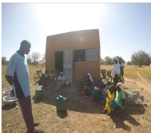
Madres con sus hijos en la cocina del CSPS

El primer día de los pesos se realiza la supervisión del stockaje quedando existencias para un par de semanas durante las cuales se darán de alta los niños que han alcanzado la normalidad.