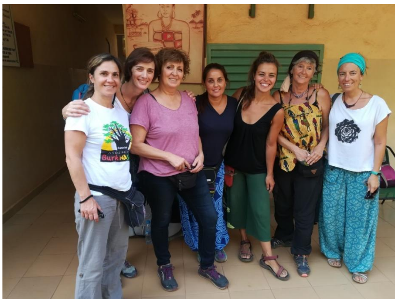
Encuentro de cooperantes en Uaga (capital Burkina Faso)

La duración del viaje ha sido desde 01 de noviembre hasta el 06 de diciembre de 2019.