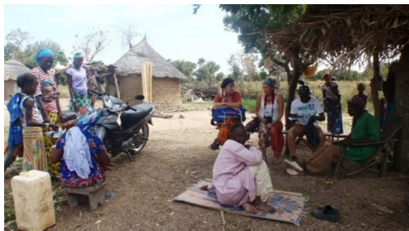
Recibimiento de familia Peul

Llegamos a una concesión de unas 10 casas donde nos esperan hombres, mujeres, niños y niñas. Nos saludan a todas muy sonrientes y nos ofrecen asiento, nos observan con curiosidad y también parecen sonreír en un día diferente al habitual.