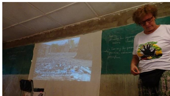
Sesión de sensibilización en escuela de secundaria de Basgana