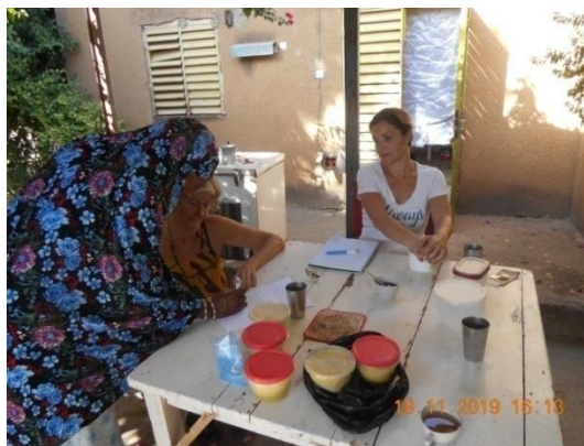
Reunión Presidenta Cooperativa Zood-Panga (Karité)

Nos confirma lo que ya veníamos temiendo. La presidenta explica que los maridos no quieren que las mujeres ganen dinero, por ello las mujeres no han podido tener iniciativas para dedicar tiempo a la elaboración, ni a las gestiones para la venta de karite en el país.