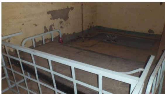
Casa de las mujeres

En el inicio del programa de desnutrición infantil en Samtenga se nos solicitó la restauración de un habitáculo que pudiera servir para quedarse aquellas madres cuyos hijos tuvieran una desnutrición severa y así poder ser controlados más de cerca.