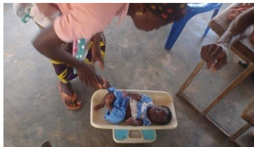
Recogida de datos talla, peso y P.B.