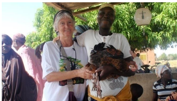
Entrega de los gallos

Durante nuestra estancia, como muestra de agradecimiento, las madres nos regalan tres gallos a la vez que refieren que sus hijos han podido salir adelante gracias al apoyo de la Asociación.