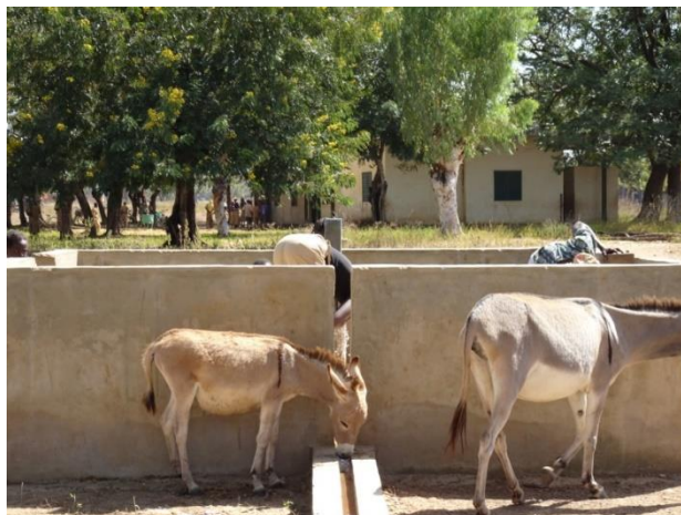
Revisión del Pozo en funcionamiento