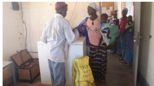
Distribución de nutrientes