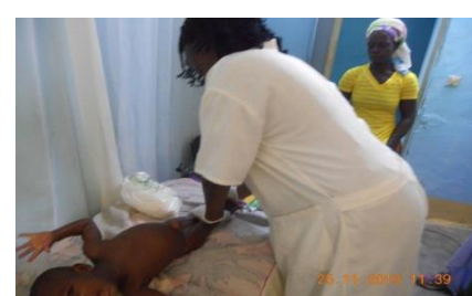
Sesión de rehabilitación

No se realiza una evaluación de la evolución de la niña, puesto que continua con el tratamiento tras la finalización del viaje, quedando pendiente para el próximo año.