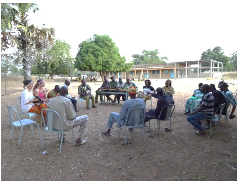
Reunión con los beneficiados junto con el Jefe el pueblo

Tras informar la situación del proyecto, se determina que la gestión del alquiler del molino pasa a ser de los representantes de la escuela, por lo que el beneficio total del alquiler debe ser destinado a solucionar las incidencias ocasionadas y compensar la escolarización del alumnado que no puede pagarlo.