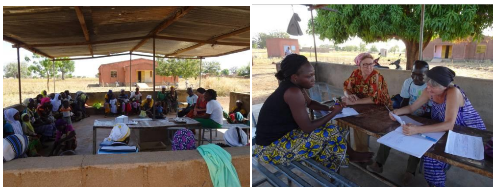
Reunión realizada con la enfermera y las madres de los niños del programa

A continuación, se pasa a la lectura de los niños que han sido dados de alta y se hace un reconocimiento de cómo se organizan las madres a la hora de realizar las comidas, formando equipos de trabajo que alternan con sus espacios de ocio.