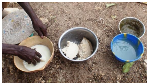
Elaboración del tô

Durante la visita nos trasladan sus dificultades de accesibilidad al agua. Nos ofrecen leche, tô y una salsa verde y gelatinosa que creamos de baobab en otro gesto más de hospitalidad.