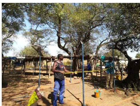
Construcción del hangar

Durante este año nos informa que su situación ha mejorado por lo que se procede a gestionar la fabricación de un pequeño hangar y una mesa donde pueda vender sus productos y ella nos facilita listado de productos comestibles y cantidades necesarias para vender. En todo momento, ella es participe de todo el proceso.