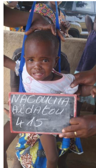
Pesaje y perímetro braquial de los infantes