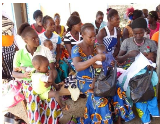
Convocatoria para la entrega de ropa infantil y enseres