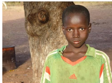
En programa durante el año 2009 /2010