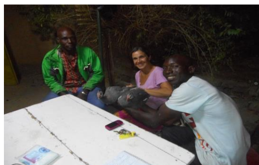
Entrega de gallinas "pintadas"