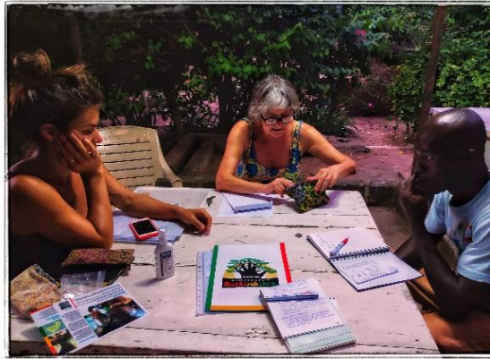
Reunión organizativa del trabajo

Durante el viaje, se realizan reuniones diarias a primera hora de la mañana para organizar el trabajo asignado, hacer seguimiento de las actividades propias de cada proyecto y programa, además de realizar las llamadas para gestionar convocatorias de reuniones con los representantes de los beneficiados.