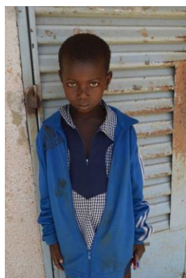
Estudiante de Primaria

En el caso de los alumnos de primaria y secundaria, la Asociación ha asumido todos los gastos de la escolaridad.