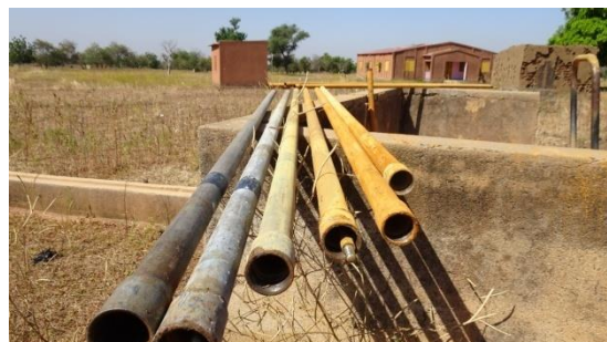
Detección de la avería del pozo CSPS de Basgana