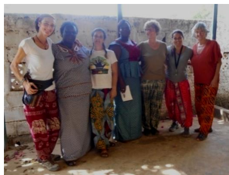
Encuentro entrega Asoc. Teel-Taaba y Asoc. Burkinasara. Canarias

Una vez han realizado la clasificación de la ropa según las necesidades, nos invitan a participar en la entrega. Parte de la ropa también la entregaran en los Dispensarios de Salud para cubrir las necesidades de muchos bebes.