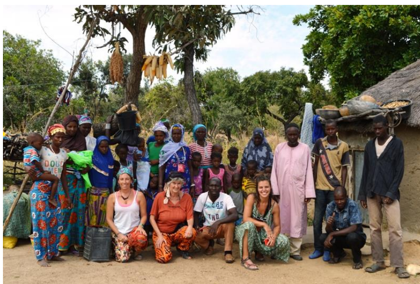
Familia Peul con la Asociación Burkinasara-Canarias