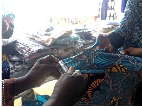
Compra de telas