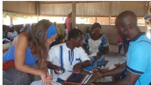
Seguimiento del control de beneficiarios en programa