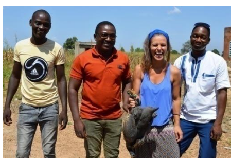
Entrega de agradecimiento

Al finalizar todas las actividades referentes al programa de desnutrición de Samtenga, el equipo de salud se muestra muy agradecido regalándonos una “pintada” (ave típica del lugar).