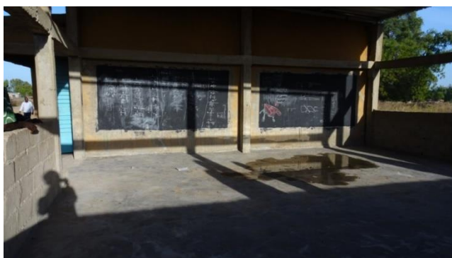
Finalización de las reparaciones del Hangar de Sena

Se lleva a cabo una reunión con el personal de la escuela, sus representantes y el jefe del pueblo, para comunicar nuestro descontento por la falta de mantenimiento, el hecho de inculcarle al alumnado el cuidado de las instalaciones, y el no haber tomado iniciativas para contactar con el constructor y subsanar las incidencias.