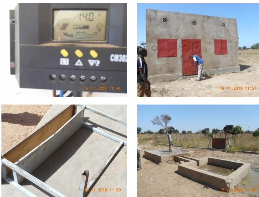
Revisión de los proyectos realizados

Se llevan a cabo varias reuniones con el director actual de la escuela y con la APE (Representante de padres de alumnos), para trasladarle las incidencias detectadas tras la revisión, con el objetivo de que se impliquen en la reparación de las mismas, haciendo hincapié en la finalidad de la cooperación, donde deben ser responsables de que se cumplan los objetivos de los proyectos.