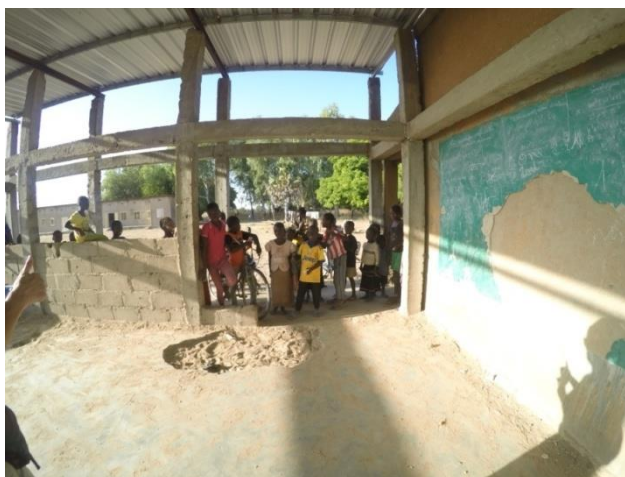
Estado inicial del hangar