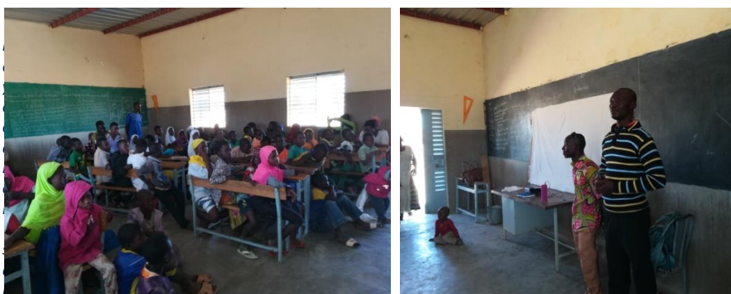
Sensibilización uso y reciclaje de plásticos

Acordamos un compromiso por su parte, esperando que nos comuniquen las iniciativas llevadas a cabo. Se les ofrece realizar una proyección al alumnado para la sensibilización del uso y reciclaje del plástico.