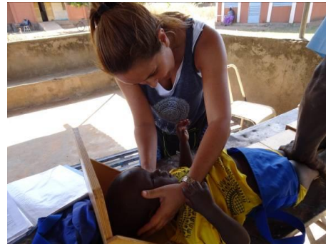
Control de los niños del programa