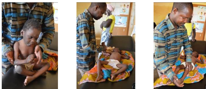
Exploración del Fisioterapeuta

La madre no ha creído que su hija tuviera alguna enfermedad y pensaba que algún día llegaría a caminar por si sola. No acuden a la nueva cita que se les da por lo que no se puede realizar ninguna actuación.