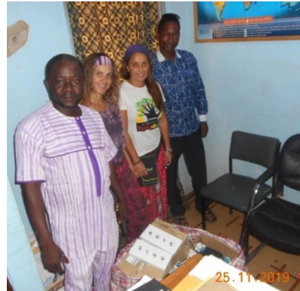
Entrega de material Sanitario al Distrito Sanitario de Manga

Nos comunica que la Provincia de Manga, cuenta con 45 CSPS, que cada uno de estos centros sanitarios realiza las demandas mediante la Dirección de la Salud, por lo que se hará la distribución del material en función de las necesidades y características de cada uno de ellos.