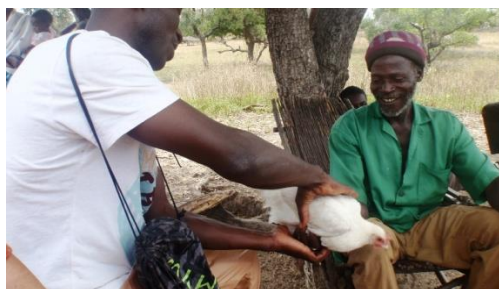
Entrega de una gallina